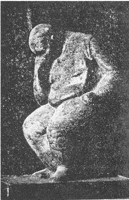
( التنب ) تمثال لكهال خليفة

وقد اثار هذا النقد الأستاذ فتحي غانم فكتب في آخر ساعة ١٩/٥/١٩٥٤ يبذل دمه دفاعاً عن ( الحوادث ) التي كانت تقصها جدته عليه ، فقال : « ان الحركات الادبية في العالم اجمع ، قامت على اساس الاعتراف بهذا النوع من الادب الشعبي في صورة الاسطورة او الخدوتة او اي اسم آخر قد تسمى به ، وهي الاساس الذي يستند اليه بنياننا الادبي والمنبع الاصيل الذي تنبع منه احاسيسنا وعواطفنا كفنانيين وادباء .. » وقال فتحي غانم انه يخشى ان يفهم من نقد رشاد رشدي « .. انه يطالب بان تكون القصة المصرية مجرد عملية وصف للبيئة والحوال الذي يعيش فيه ابطال القصة ، او وصف حالة شعورية معينة يعيش فيها ابطال القصة بضع لحظات ، ففي الحقيقة لا شيء يوضح لنا حقيقة مشاعر الناس وآراءهم وموقفهم من الحياة مثل ان يعرضوا الى حادث