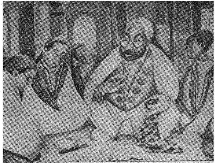
درس في الجامعة - للزمير التركي