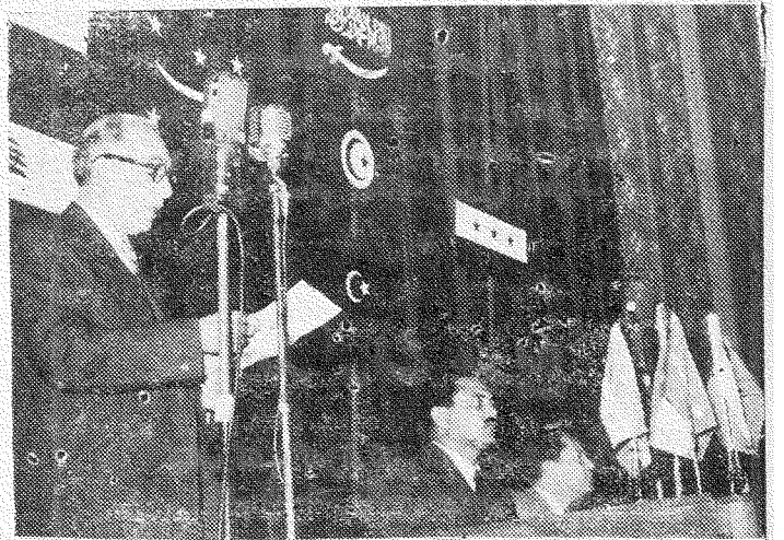
مندوب الجامعة العربية الاستاذ سعيد فهم يلقي كلمته . ويبدو في الرسم السيد كمال الدين حسين وزير التربية والاستاذ يوسف السباعي سكرتير المؤتمر

وتبعه الدكتور طه حسين مندوباً عن الوفد المصري في المؤتمر فتوجه الى المؤتمرين قائلاً : « كل ما اطلبه اليكم او تطلبونه لانفسكم في الاجتماعات المقبلة هو ان تلاثموا بين واجب الادب حقيقة بالقياس الى القومية العربية،