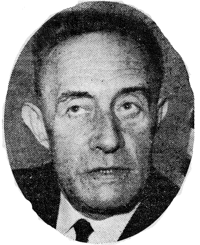
هنري دو مونترلان