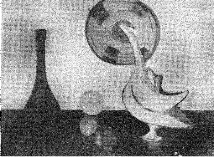
طبيعة صامتة « زيتية » - نزيهة سليم