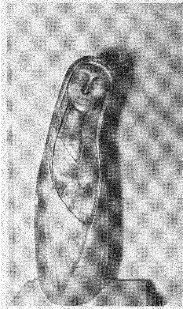
نظرة ذات معنى - خليل الورد