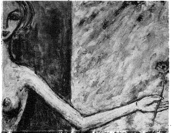
صورة فتاة - جبرا ابراهيم جبرا ( ١٩٦٥ )

الا اننا نراها تتباعد عن هذا الاسلوب في لوحتها « طبيعة صامتة » وهي تمثال على شكل « اوزة » .. صامتة في وقفة جامدة ، وحركة استثنائية ، تقبع بجانبها جرة غامقة اللون بلا حركة .. وطبيعة صامتة التي رأيناها عند اكثر الرسامين وخاصة فسي معرض (X) .