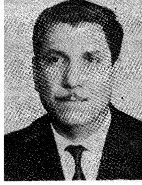
بقلم عبد الوهاب البياتي

قال محتوي لعاشق : ايها الفسى انت قد رايت في غريبك مدى كثره فحبرني : ايه مدينته من ههذه اطيب ، . . فاجاب : بلك المدينه التي فيها من اخطف لملي من مصيده « مدينة السلق » لجلال الدين الرومي