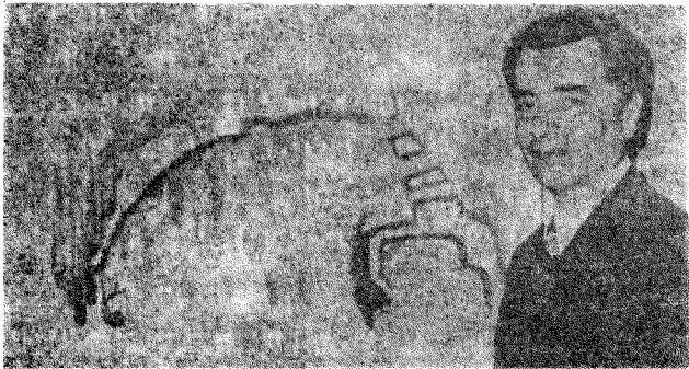
الفنان نعيم اسماعيل

نعيم اسماعيل خسارة أخرى فادحة للفن التشكيلي