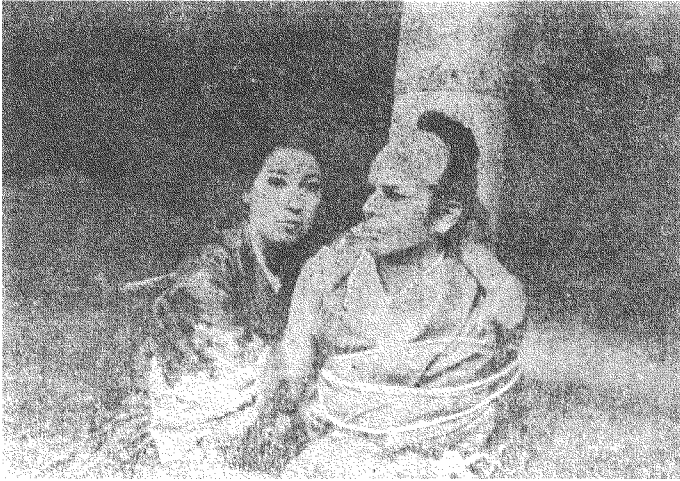
« راشومون »

وتتجسد فصول الحكاية ، كل مرة من وجهة نظر : قاطع الطريق ، ثم الزوجة ، ثم روح الزوج ، وأخيرا الخطاب الذي شهد الاحداث خفية وأنكر ، لانه سرق سيف الزوج الفضي . كل منهم كان يحاول اضعاف النبيل والشرف والبطولة على موقفه ، ولكن كل منهم كان في أعماقه على عكس الصورة التي يظهر ، جباناً وأنايباً وخسيساً . حتى الخطاب قد كذب وشهد زوراً . هذا هو موضع سخرية صانع الشعر المستعار الذي يهاجمه بتهكمه اللاذع هو والكاهن ، مؤكداً على فلسفته السلبية في الحياة وعدم ايمانه بالانسان . ويعثر الثلاثة على طفل لقيط في الغابة ، وبينما يسرق صانع الشعر المستعار بطانية الطفل الصوفية مبرراً لنفسه تلك الجريمة ، يحتضن الخطاب الفقير ليؤويه ويربيه . أما الكاهن فيمضي في طريقه وقد آمن ان درب الخلاص ليس في عزلة الاديبة بل في الاحتكاك بالبشر وملامسة همومهم . ان الخطاب هو نموذج الانسان الذي يخطيء ولكن لانه وأولاده جائعون ، أما في أعماقه فهو أنبلهم جميعاً وأشدهم انسانية .