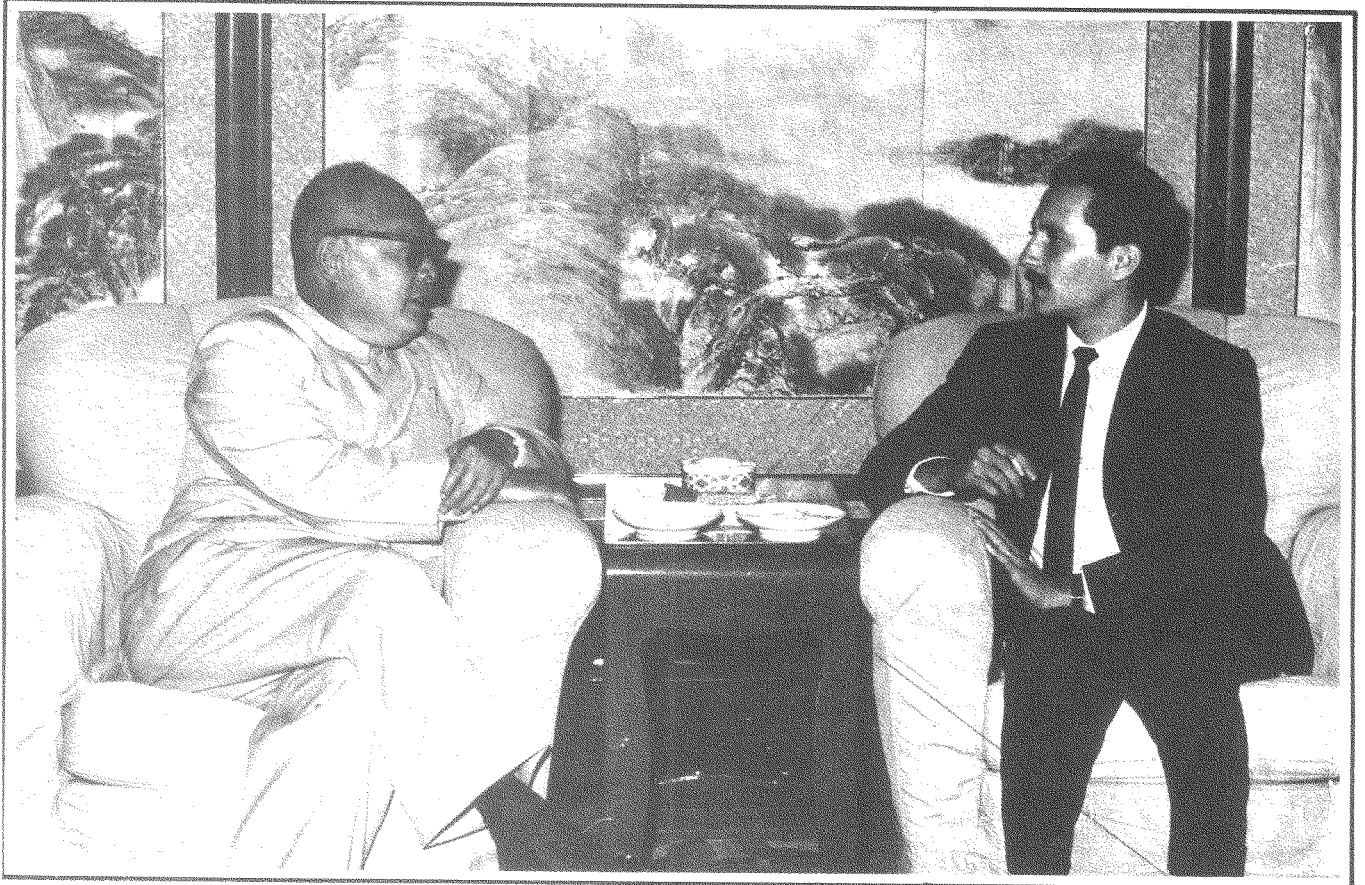
مع شن لي، وزير الخارجية الصينية (١٩٦٥)

وكان غسان معجباً بإنجازات ماوتسي تونغ. والصحفيّ شأن غسان لم يكن يُتاح له أن يرى أثناء زيارته للصين سوى الإنجازات التي يُريها له القادة هناك. ولا ننس أن الصين كانت داعماً أساسياً للثورة الفلسطينية.