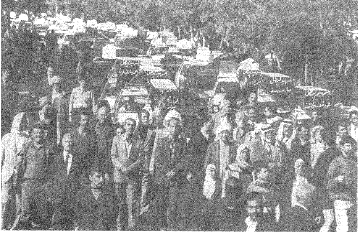
تشبييع جماعي لضحايا القصف في بغداد