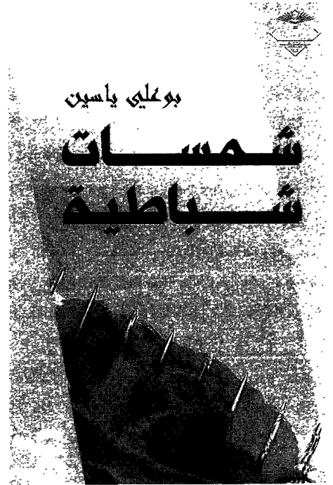
شمسات شباطية: مُنح في الكويت استناداً إلى اسم مؤلفه فقط