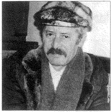
اخترت أن أدرس هذا النصّ لمحمد شكري، على الرغم من كونه صادماً

انتهى العام الدراسي بعد الأزمة بحوالي أسبوعين. ورحل الزميل الفرنسي عن قسمنا في الجامعة، وترحمت أنا على إجازتي البحثية التي كانت قد أوشكت على الانتهاء، واستعددت للعام الدراسي الجديد وأنا أقول لنفسي مازحة: «سندرس مجلات ك سميير وميكي عما قريب حتى نحافظ على ثوابت الأمة». لكنني في الواقع لم أدرس سميير وميكي، بل اخترت أن أدرس في فصلي الدراسي عن الأدب العربي الحديث نصّ الخبز الحافي ، السيرة الذاتية الروائية لمحمد شكري، الكاتب المغربي المعروف بموقعه المتفرد في الإنتاج الأدبي العربي الحديث.