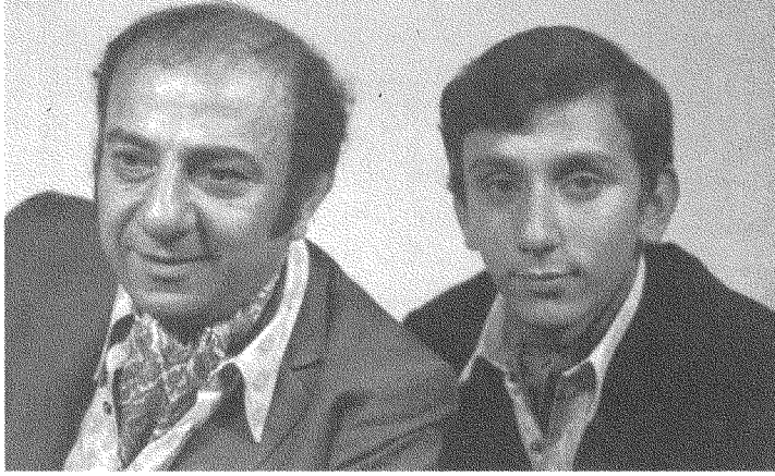
زياد وعاصي الرحباني.

«لا أحبّ طريقة معالجة الرحبانيين. يأخذان مواضيع كبرى ويسطحانها. الحياة ليست بهذه البساطة التي يتصورها الرحبانيان. الكثافة الإنسانية غير موجودة في المسرح الرحباني لأنه يقسم العالم بين أبيض وأسود، وبين صالح وشرير...»