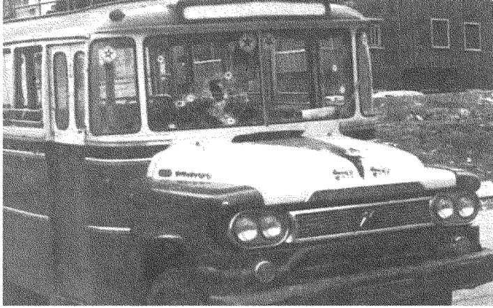
الحرب الأهلية اللبنانية: صدمة كبيرة للثقافة الريفية (بوسطة عين الرمانة ١٣/٤/١٩٧٥).

لكنّ الحرب الأهلية التي اندلعت سنة ١٩٧٥ شكّلت صدمة كبيرة للثقافة الريفية التي تغنى بها كثيرٌ من الأدباء والفنّانين في لبنان، وفي طبيعتهم الأخوان