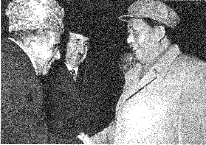
عبد الله إبراهيم (يمين) وماوتسي تونغ يستقبل علي يعطا أمين عام الحزب الشيوعي المغربي (يسار).